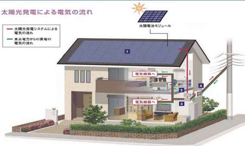
太陽光発電による電気の流れ